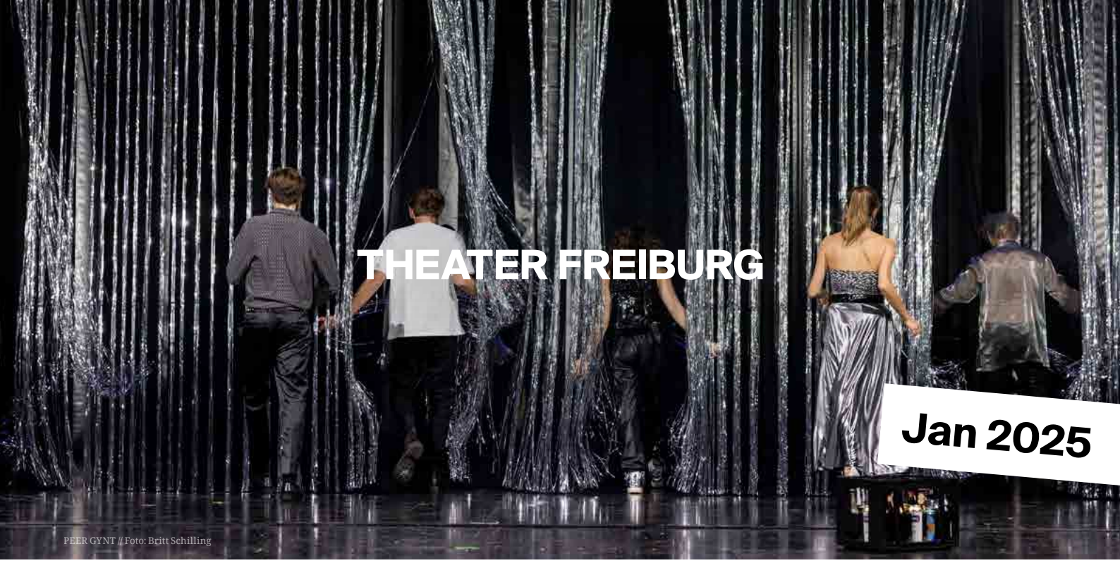
PEER GYNT / Foto: Britt Schilling