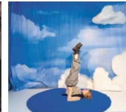
ELLA BO VERSE