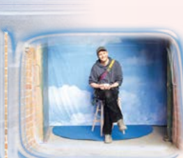
FELIX VON NOSTITZ- WALLWITZ